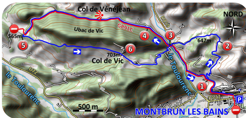
Carte IGN 3240 OT

Plus loin, l'itinéraire s'oriente franchement vers le sud et on rejoint une large piste. Quitter ici les marques rouges et blanches du GR pour filer à gauche vers l'est (5). Un petit crochet bien balisé (marques jaunes) est nécessaire pour contourner la ferme Truphémus. Au-delà, nous retrouvons une large piste simple à suivre. Au col de Vic (6), entamer la descente par la route goudronnée jusqu'au pont de Vénéjean déjà franchi (3). Prendre à droite sur la D159, puis tourner sur la deuxième route à gauche après 400 mètres. Remonter jusqu'à la porte Sainte Marie et flâner dans les calades étroites du vieux village.