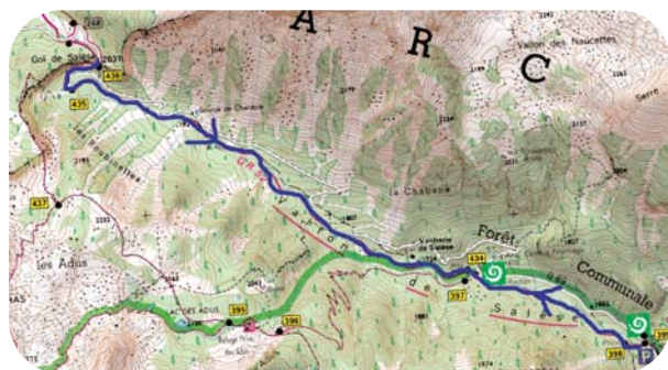
Carte IGN 3741 OT Extrait carte IGN SCAN 25 ® - © IGN 2007 Copie et reproduction Interdite

Les buttes tout autour du col sont autant de panoramas sur les environs.