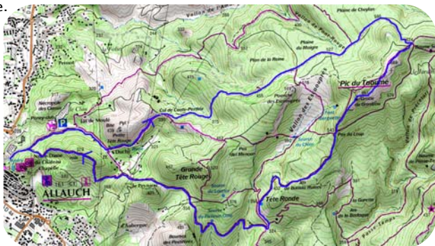
Carte IGN 3245 ET

Plus loin le sentier grimpe sur la colline avant de passer devant d'anciennes ruines. Au niveau du col sous le château, prendre la sente à droite jusqu'à la route qui ramène au village (5h).